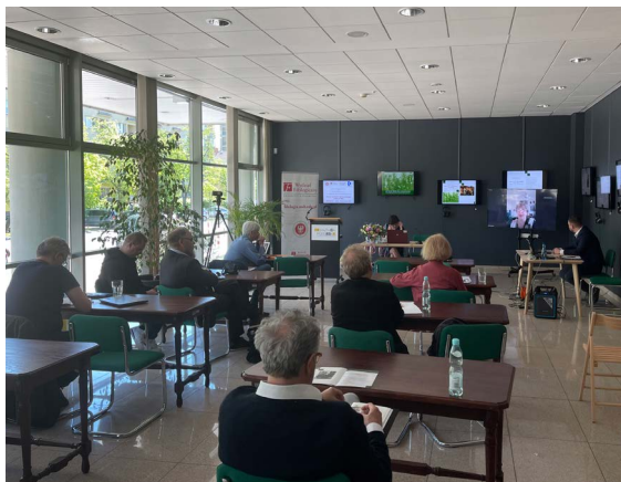
Obrady plenarne konferencji